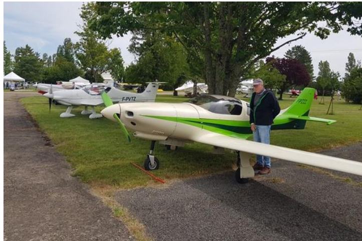
Enormément de constructions amateurs F-Pxxx

Bien, avoir un but de promenade est une bonne chose mais le plaisir des motards est quand même de piloter sa machine et pour cela il n'était pas question de prendre l'autoroute pour nous y rendre mais plutôt d'emprunter des routes calmes et agréables pour apprécier pleinement notre plaisir de chevaucher nos montures. Pour cela, la route choisie à l'aller fut au départ de Montereau de rejoindre Nogent Sur Seine, Troyes et Brienne. Quant au retour ce fut par Troyes et Sens toujours hors autoroute. Le midi, les participants décidèrent à l'unanimité de se restaurer dans une gargote sur le chemin du retour. Une fois celle-ci dénichée et où la tenancière nous accepta malgré notre arrivée tardive (15 mn avant la fin du service). Ceci étant nous n'avons pas été pressé pour libérer les lieux et c'est vers 14h45 que nous reprenions la route avec une température idéale pour une promenade. La fin de la sortie sonna autour d'un dernier pot dans une rue piétonnière de Bray Sur Seine.