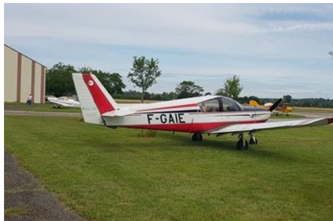
Wassmer d'un collègue de la section S2A présent au rassemblement