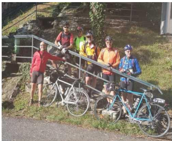
Départ du groupe cyclo