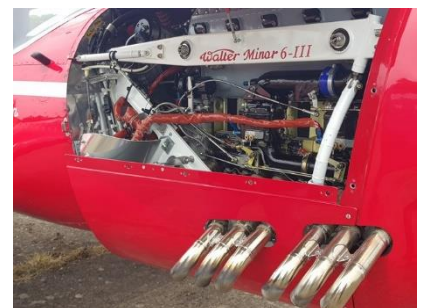
Moteur 6 cylindres Walter Minor

Le rassemblement aurait dû se tenir le week-end des 6 et 7 mais les limitations aéronautiques annoncées pour le 7 à cause du Tour de France vélo dans la région a conduit l'aérodrome à avancer l'évènement d'une journée. Ce rassemblement est l'occasion de voir une très grande majorité de machines (avions et ULM) construites par des amateurs mais aussi des avions de collections qui sont toujours en état de voler. Des stands tenus à proximité proposaient des services tels que des assurances, ou bien des renseignements sur les formations de pilotes, mais aussi des stands avec des pièces neuves ou d'occasions et bien sûr de quoi se restaurer ou se désaltérer.