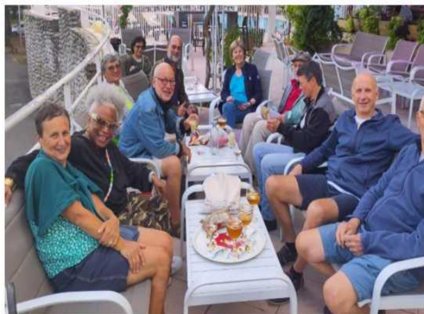
Après l'effort le réconfort

Vogüé, village pittoresque de l'Ardèche classé parmi les « Plus beaux villages de France », est le point de départ de nos différentes randonnées. Nous logeons au Domaine Lou Capitelle, bien connu pour l'accueil des groupes cyclos, au cœur d'un site exceptionnel en bordure de l'Ardèche. Au cours de la semaine, nous profitons pour déguster les nombreuses spécialités locales, notamment les criques, les caillettes, la maoche, sans oublier le macaron de Joyeuse. Un vrai régal !