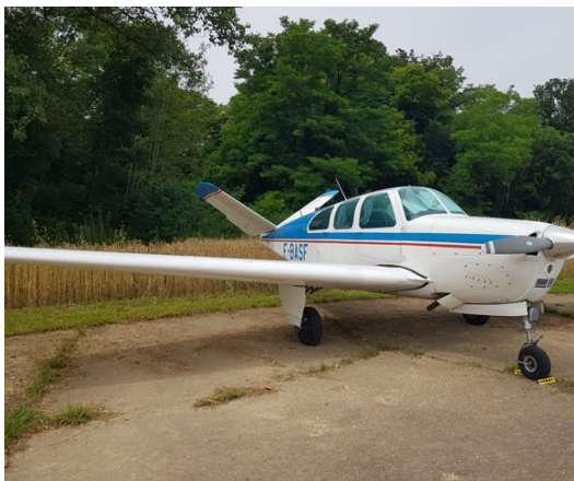
Beechcraft modèle Bonanza