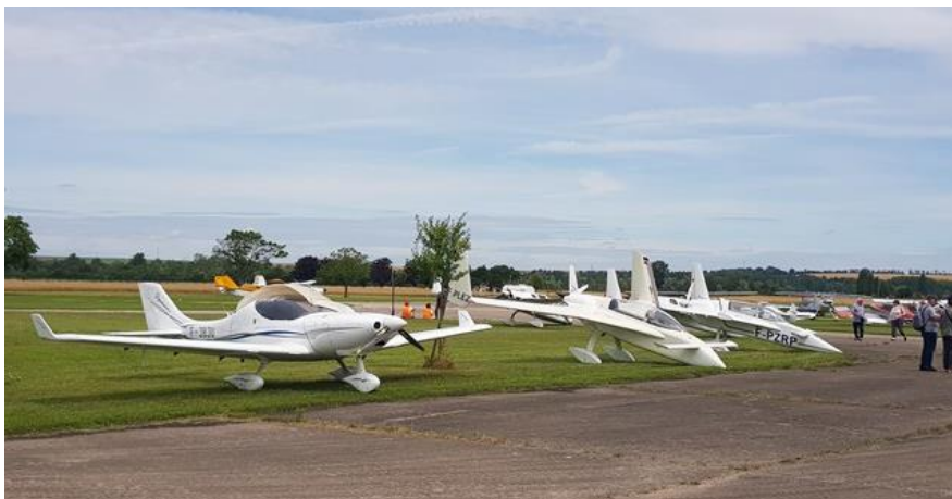
Des appareils aux allures étranges....

Ce vendredi 5 juillet 2024, le moto club a proposé à ses adhérents et adhérentes une sortie sur la journée avec pour destination l'aérodrome de Brienne le Château qui est situé sur la commune de Saint-Léger sous Brienne.