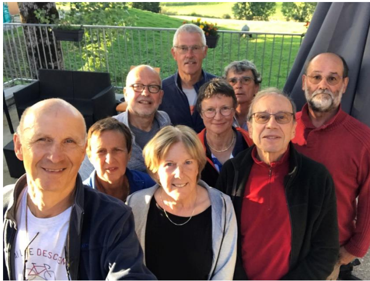
Le groupe COSEG Renardières à Métabief

2. La semaine vélo-rando à Métabief du 2 septembre au 10 Septembre.