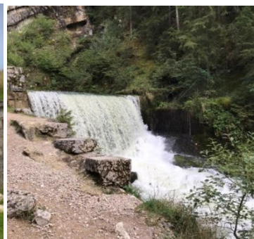
Source du Doubs à Mouthé