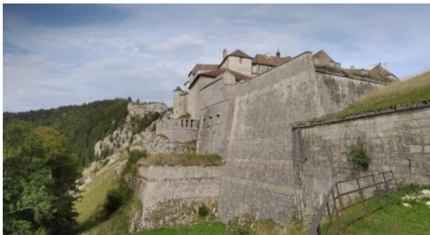
Château de la Joux

Lors de nos différentes sorties, nous sommes charmés par la beauté des paysages entre lacs et montagnes. Les panoramas sont à couper le souffle, dont un point de vue à 360° sur la chaîne des Alpes, le lac de Neuchâtel et les plateaux du Haut-Doubs.